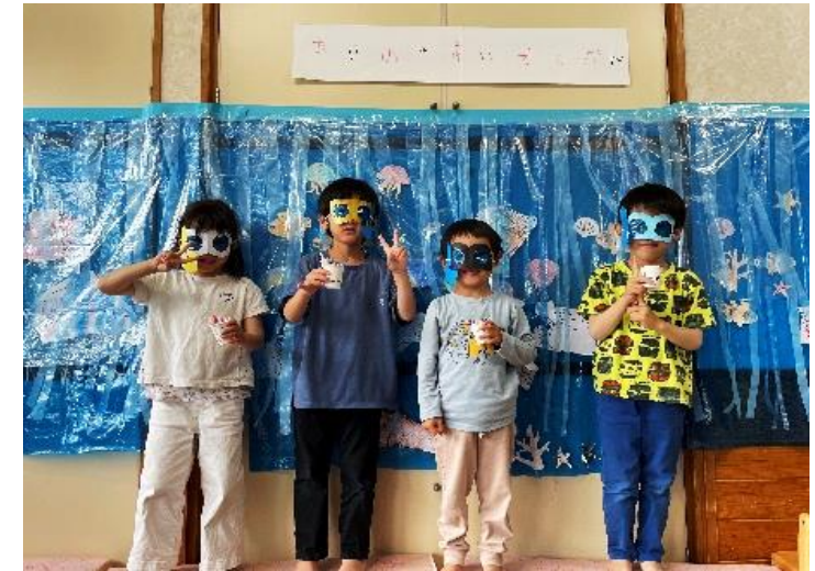
あいのみ水族館つくったよ♪