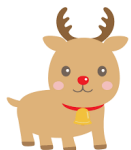
サンタさん ありがとう🎁